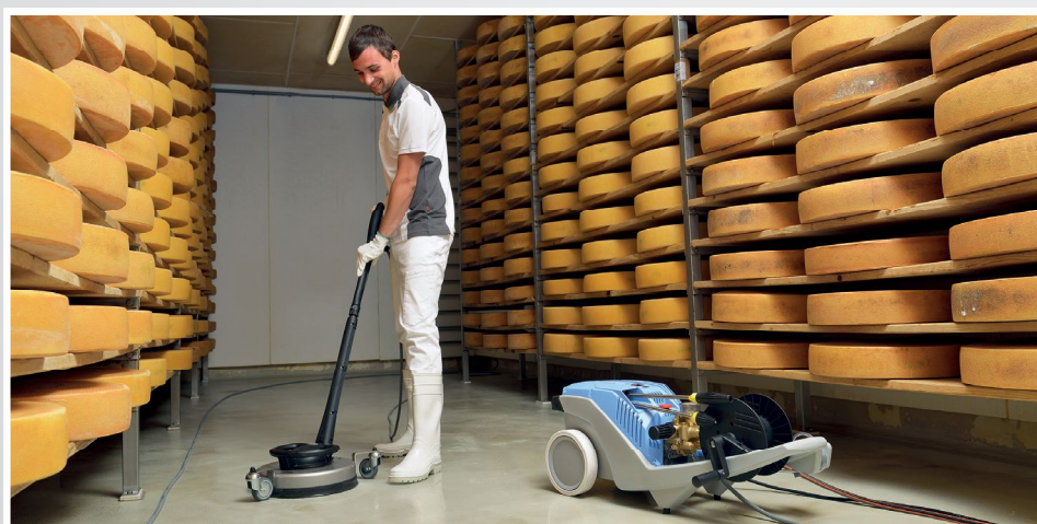
Fig. Version Non-Marking (NoM). Page Info 58