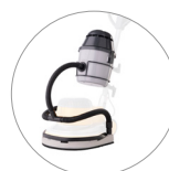
Groupe aspirant (en option)