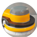
Possibilité d'utiliser des poids additionnels (en option)