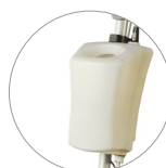
Réservoir 12 litres (en option)