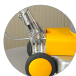
Articulation du manche