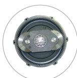
Réducteur à satellites et planétaire (L22)