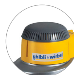
Nouveau couvercle en plastique (L22)