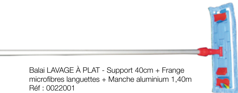
Balai LAVAGE À PLAT - Support 40cm + Frange microfibres languettes + Manche aluminium 1,40m Réf : 0022001