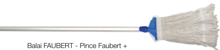
Balai FAUBERT - Pince Faubert + Frange 350g + Manche aluminium 1,40m Réf : 0022005