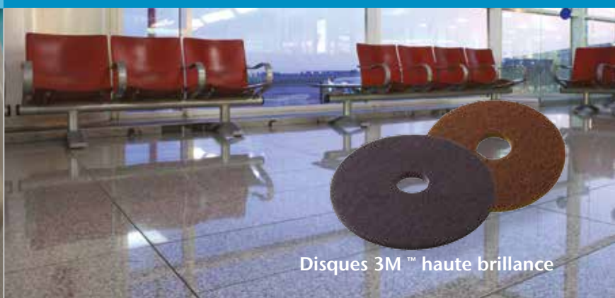
Disques 3M™ haute brillance